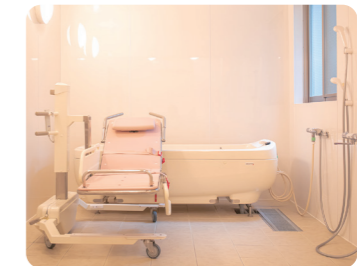
入浴が困難の方も安心して入浴できる「リフト浴」を導入

クリニック・歯科・薬局・訪問鍼灸・給食会社など生活に欠かせない事業所と連携していますので、快適で安全な生活を過ごしていただけます。